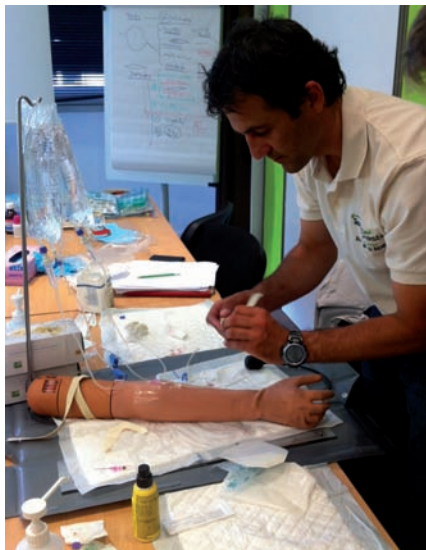
Formation Médicale Hauturière – Préparation Vendée Globe.