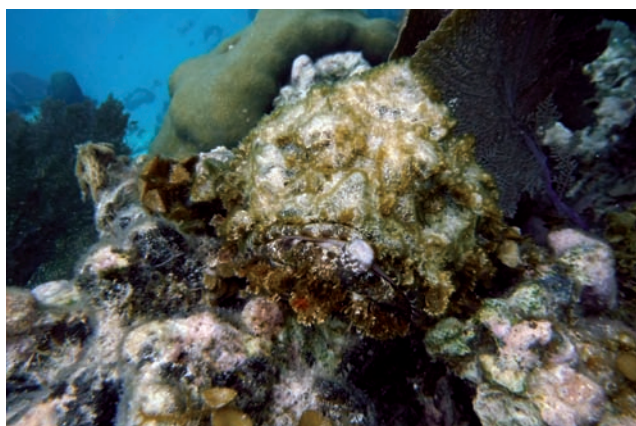
Poisson-pierre : un as du camouflage à la piqûre redoutable !

Lorsqu'un navigateur a besoin d'un avis médical ou d'une consultation, il prend directement contact avec le Service d'Assistance Télé Médicale (TMAS) ou par l'intermédiaire du MRCC ou du CROSS. Le Centre de Consultations Médicales Maritimes français (CCMM) est joignable 365 jours par an et 24h/24. Il est souhaitable de solliciter son avis pour toute personne malade, blessée, intoxiquée ou brûlée ainsi qu'avant toute administration de