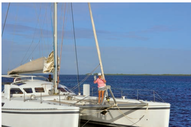
Prévention : le maître-mot. Port de gants et chaussures impératif lors des manœuvres de mouillage.