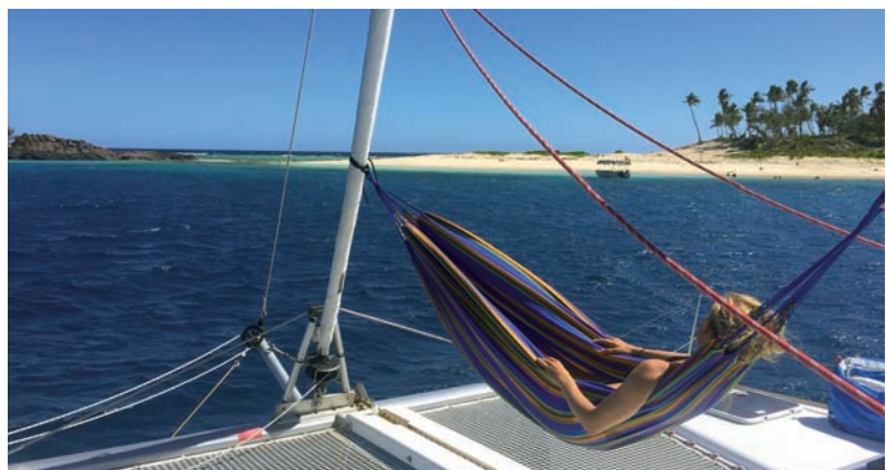
Il ne reste plus qu'à profiter à fond de votre voyage...